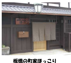
板橋の町家ほっこり