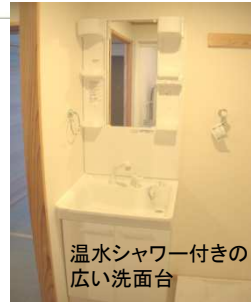
温水シャワー付きの広い洗面台