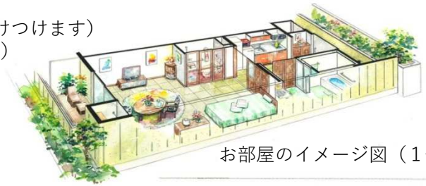
お部屋のイメージ図（1例）