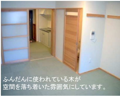
ふんだんに使われている木が空間を落ち着いた雰囲気にはしています。