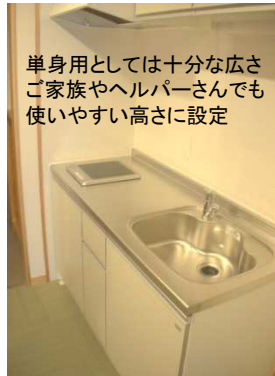
単身用としては十分な広さご家族やヘルパーさんでも使いやすい高さに設定