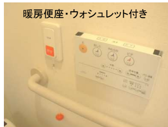
暖房便座・ウォシュレット付き