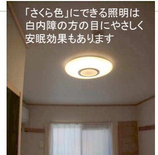
「さくら色」にできる照明は白内障の方の目にやさしく安眠効果もあります