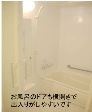
お風呂のドアも横開きで出入りがしやすいです