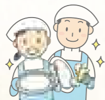
図1 ● 障がい者就労継続支援事業

ワークパートナーYUIでは、一人で自立して仕事ができる方が「A型」、指導員の見守りが必要な方、または、能力的にA型で働けるが体調に不安のある方が「B型」と割り振りしています。現在の利用者数はA型18名、B型10名です。清掃や工作、洗車などが日々の業務です。(図1)