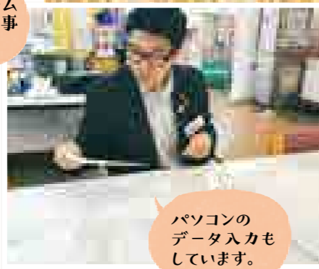
パソコンのデータ入力もしています。