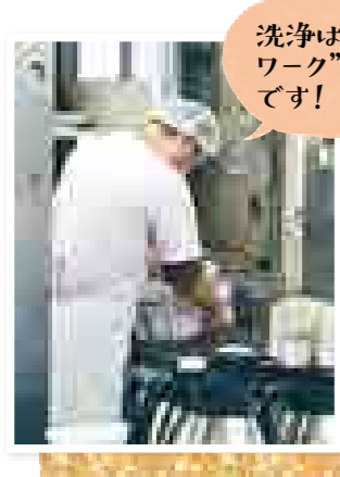
洗浄は“チームワーク”が大事です!