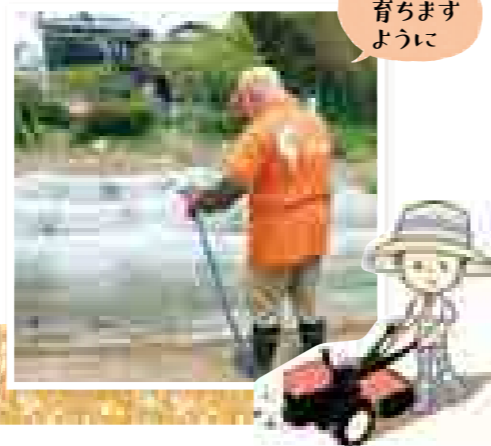
立派に育ちますように