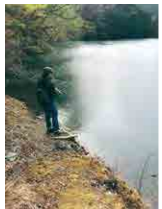
休日は釣りでリフレッシュ

就職前の学生さんは「社会人になったら仕事ばかりで遊べなくなるんだらうなあ…」と思うかもしれませんが、京都老人福祉協会ではそんな心配は無用です。社会人として働きながらも、長い休暇で旅行に出かけたり趣味に打ち込むことができます。