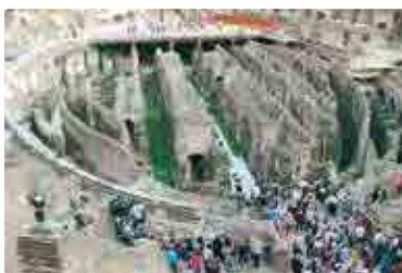
リフレッシュ休暇で海外へ

その結果、公休が114日となり、そこに年末年始休暇4日とリフレッシュ休暇7日を加え、年間休日125日を