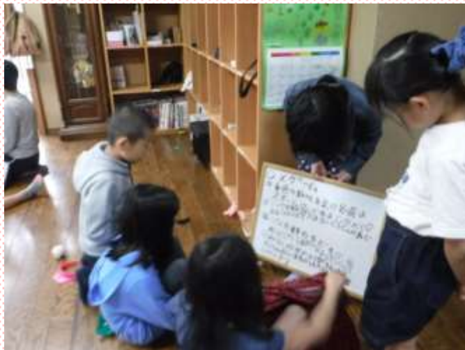
○×クイズを楽しむ子どもたち