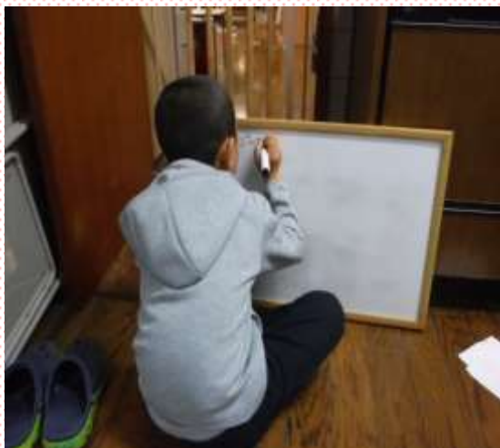
違う問題を書く子どもたち