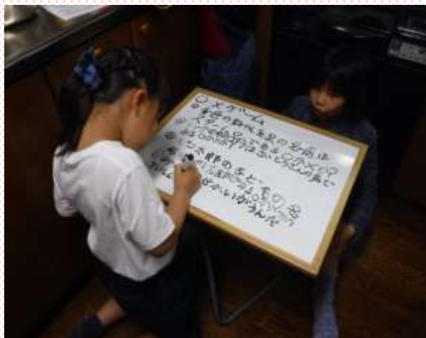
考えた○×クイズをホワイトボードに書いている