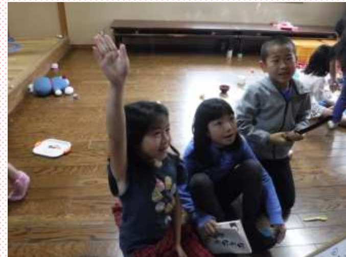
手を挙げて答えを言う子どもたち