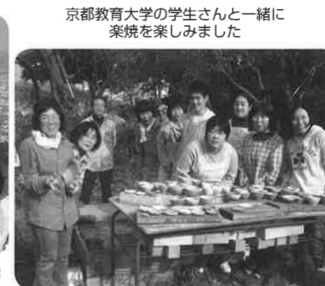
京都教育大学の学生さんと一緒に 楽焼を楽しみました