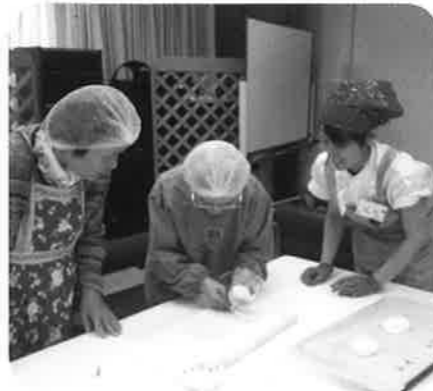
パンの型作成中! さて何パン?

今年の4月からさつちん「さくら」では、介護の利用者さまとパンサークルを始めました。活動内容は月に1回、14時半～16時の1時間半で、1次発酵まで終わった生地を麺棒でのばし、一人ひとりいろいろな形のパンを作っている、2次発酵を待つから、オーブンで焼きます。焼いている待ち時間に、前回行ったパン作りの写真を貼り、「パンサークル新聞」を完成させます。「4月はさくらあんぱんやつたなあ」「今日の方が上手く作れた」