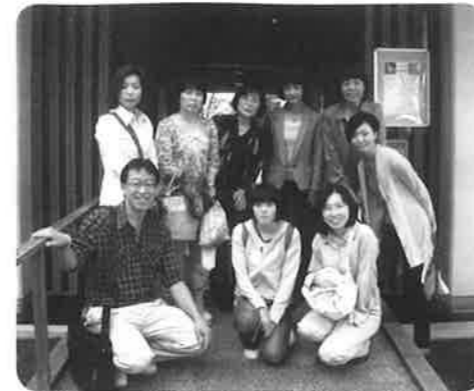
障がい者雇用発信委員会施設見学

今回のビデオ紹介や委員会の様々な活動を通じて、少しでも多くの方に障がい者雇用についての問題や現状を理解していただき、たくさんの方に協力をしてもらいながら「障がいがあっても働ける環境づくり」に協力していければと思っています。