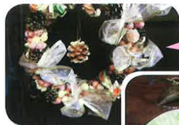
第1回作品 クリスマス リース

初回は福祉関係者も含め21名の参加があり、沢山の花を使ってのクリスマスリース作りを行いました。初めは隣に座る人を知らない方もおられ、話しくそうなる雰囲気でしたが、和喫茶での昼食時には話もはずみ、和気あいあいとした雰囲気になりました。