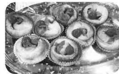
かわいいトマトパンの出来上り

「たね」と新聞を作りながら話してみます。掲載の写真からもパンや新聞を生き生きと楽しそうに作っている様子が伝わってきます。そしてパンが焼けたら、焼き立てパンと一緒にティータイムを楽しみます。皆さん自分で作ったパンはひと味違って格別美味しくわ!と満面の笑顔で食べられます。