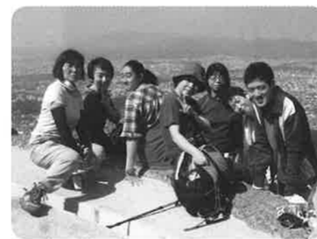
ハイカーほっこりサークルと共に大文字山登山

経過… 各事業所の雇用状況確認・実習生受け入れ・行政制作のビデオ学習会・京都府内の施設見学と京都府障害者職業センターの研修・セミナー参加・事例研究と受け入れ相談等4年の間、職員の入れ替わりをしながらこの会は紡ぎ続けられてきました。 主な取組紹介… 講師を招いての研修会は、三回行いました。京都教育大学付属支援学校の先生とオリープホットハウスの専門職の方、そして、だいが学園の相談員を招きお話を伺いました。