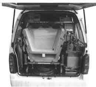
車内には、組立式の浴槽が収納され力持ちの職員が利用者さんの家まで運びます

スタッフ3名が楽々乗車できますし、分割式の浴槽も今までの物と変わらないサイズです。しかも、お湯が冷めにくい遠赤浴槽!! ご自宅での入浴のひとつ。清潔の保持や健康チェックのみならず、お湯につかる事がもたらすリラックス効果もあります。お一人お一人の生活の質を考える時、欠かす事の出来ない時間ではないでしょうか。小さな煙突を付けた京老訪問入浴車は、今日も明日も伏見を走る。お風呂に入れなくて困っておられる方がいる限り。