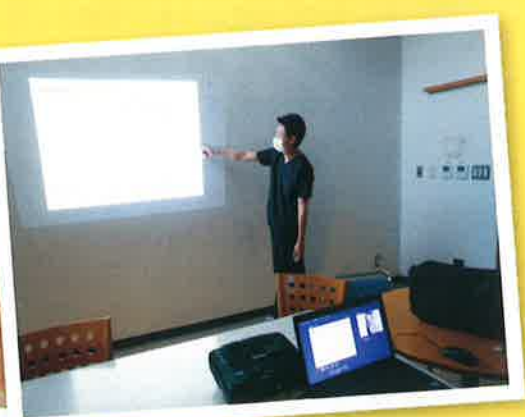
褥瘡・拘束委員会の研修中