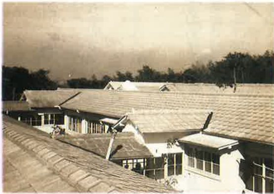
京都老人ホーム (左:1970年代 右:現在)