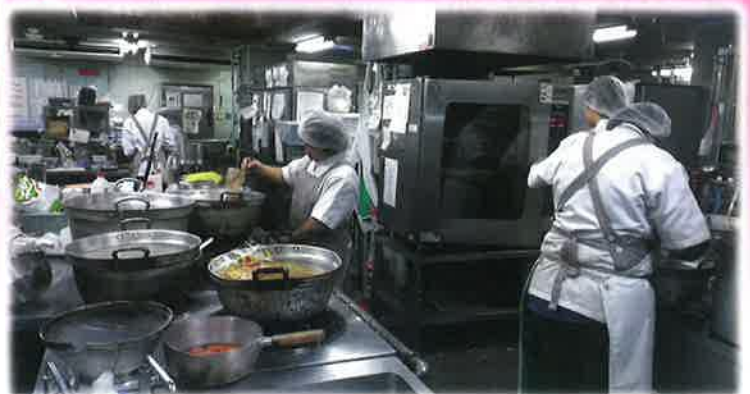
厨房「きっちんさくら」で働く職員 (左:1970年代 右:現在)