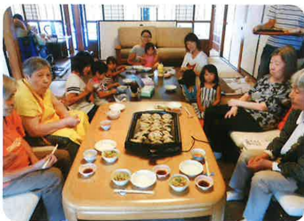
みんなで餃子パーティー

日常のなかで、高齢者が2階にあがって子どもたちが遊んでいる様子を見て和んだり、1階に子どもやお母さんが下りて来て一緒におやつを食べたりと自由に交流できる場となっています。ある子どもにはお気に入りの好きなおばあちゃんがあります。また、子どもが大好きであやすのが得意な高齢者の利用者もおられます。