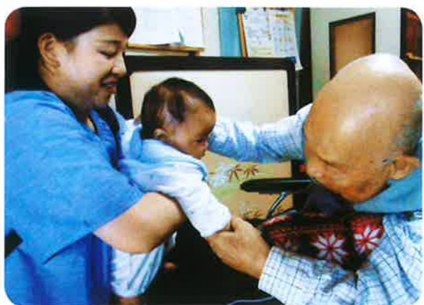
離れて暮らす家族とも会える場