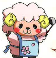
きっちゃん「さくら」 イメージキャラ