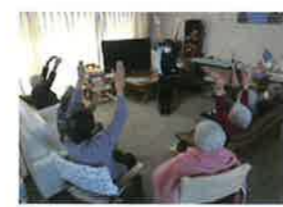
醍醐の家ほっこりグループホーム

京都老人福祉協会の各事業所でも、リハビリの一環として体操の時間を設けており、利用者様も楽しく取り組まれていましたが、現在は新型コロナウイルス感染予防の為、やむを得ず中止している所もあります…。コロナ禍で、できることが制限される日々ですが、その中でも、利用者の皆様に楽しんで頂けることを考えながら、サービスを提供しています。