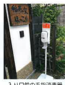
入り口前の手指消毒器