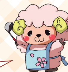
きっちゃん「さくら」 イメージキャラ